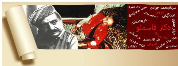
دومین نامه ی سردار اخراجی سپاه به محمد نوری زاد

دستور کار شناسایی سران مخالف نظام و ترور آنان در داخل و خارج کشور بود. لیستی حدود 100 نفره تهیه شده بود که در صدر آن لیست مسعود رجوی و قاسملو قرار داشت. در این راستا سر تیم ترور قاسملو کسی جز محمد جوادی نبود. او وظیفه داشت تا علاوه بر کسب اطلاعات از طریق طالبانی و کاک نوشیروان به شکل مقتضی امکان دیدار و ملاقات با قاسملو را به بهانه مذاکره آشتی و اعطای امتیازات به حزب دموکرات کردستان ایران را فراهم کند عملیاتی فریب که انصافاً جلال و کاک نوشیروان برای این مقصود سنگ تمام گذاشتند و پس از آن نیز از مساعدت مالی و همچنین سکنی در کاخ کوچکی در دروس نهران خیابان بارمحمدی بن بست ظاهر- جایی که اکنون علی شمخانی با تخریب آن کاخ قدیمی عمارت 4 طبقه ای بنا کرده است- پاداش خیانت خود را دریافت کرد.