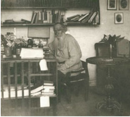
ژووری کاری تۆلستوی

کۆتایی ئۆکتوبری 1910 له شاری "ياسنا پاپالیانا"ی روسیا. ژووری کاری تۆلستوی زۆر ساکار و دوور له رازانهوهیه و وهک له وینه ناودارهکهی دا دهبینرئ، زۆر تیکهڵ و پیکهڵه.