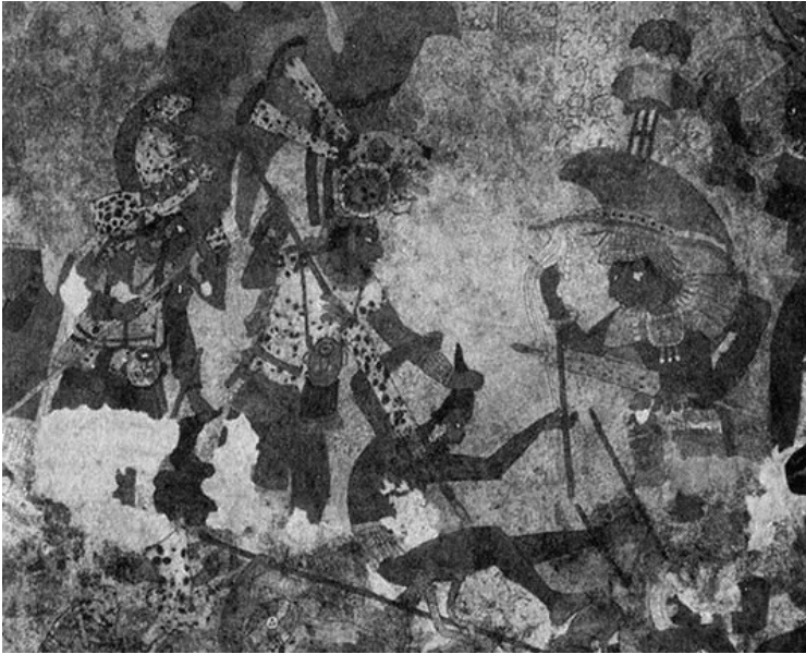
وتنه‌ی ٩، وهک له دیواره پنگوره‌نگه‌کانی "Bonampak, Mexiko" ده‌رۆبه‌ری ٨٠٠ پێش زاینیدا ده‌رده‌که‌وتیت، بۆ مایاکان "Maya" شه‌ر شیوازیکێ ناسایی ژیان بووه.

شوینه‌واره‌کان به‌لگه‌ی جۆراوجۆر بۆ مملانیی نیوان خه‌لکه‌کان ده‌خه‌نه‌ روو. ٣١ زۆریک له پیکهاته سه‌رنج‌راکیشه‌کانی میژوو خزمه‌تیان به ئامانجی به‌رگری کردوو، وهک دیواری گه‌وره‌ی چین، دیواری هادریان "Hadrian's Wall" له سکۆتله‌ند، قه‌لا و دیواره‌ شازه‌کانی ئه‌روپا و ژاپۆن، شوینی نیشه‌جی‌بوونی به‌ردینی هۆزه‌کانی ئه‌ناسازی له باشووری رۆژئاوای ئه‌مریکا و دیواره‌کانی شار له ئورشلیم و قوسته‌نتینییه. ته‌نانه‌ت ئه‌کرۆپۆلیس "Akropolis" یش له راستیدا شارێکی قه‌لای دیواردار بووه.