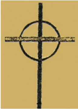
نیشانەى كورت كراو هى چوار خاچ

زۆر كەس لە ژيانى رۆژانهياندا وەك پيشگوويى و فالگرتنەوه باوەريان پىي هەيه. نيشانەى كورت كراو مەكەى ئەو هيه: