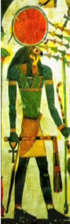
"هوروس" خودای ههتاو (رۆشنایی)

به پئی دۆزراوهکان و بهردهنوسهکانی میسر و دهور و بهری، روون بۆتوهه که ئهوکات مرۆف ههتاویان به خودا داناوه و باوهریان لهسهه نهوه بووه که ههموو بهیانیهک خودای ههتاو بهسهه خودای تاریکی واته "سیت" دا ، زال دهی. ههموو ئیواهرهیهکیش به پێچهوانه خودای تاریکی، خودای رۆشنایی شکست داوه.