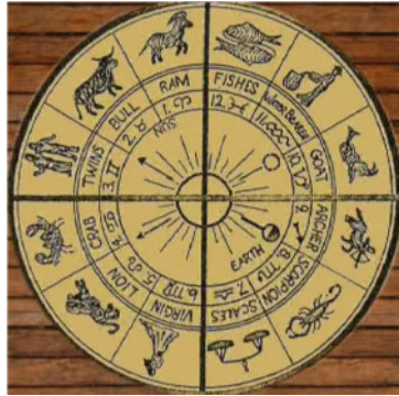
چوار خاچى نازەل

ئەگەر سەرنج بەمىنه نيشانە كورت كراو هى چوار خاچ، دەبينين كە بازنەيهك لە دەورى خاچەكەيه. هەركات وىنەى مەسيح نيشاندەدرئيت بازنەيهكيش لە دەورى سەرى دەكيشنەوه. كە وابوو، مەسيحيان پىي هەتاو بووه. كورى خودا و رووناكايى جيهان. بەو بۆچوونەيان عيسا لەگەل هەتاو هەلدەسەنگينن، كە وەك ناوهندىك هەموو رۆژىك هەلدى و گەرما و رۆشنايى بە زەوى و مەرفە دەدا!