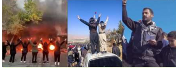
له تاران فاشیست، له کوردستان داگیرکر! دوتنی نهمرق سیهینی

پیشیلهکهی هیرمان له بیرى نهچى کاتی گهراڼهویه، خهکى کۆلان دهنکی دهناسنهوه و دهرگا له سهر گازی پشت ئوالهیه!