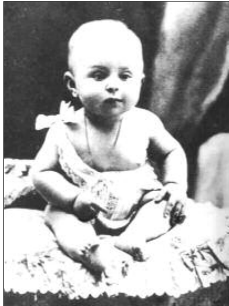
سارتهر به منالی