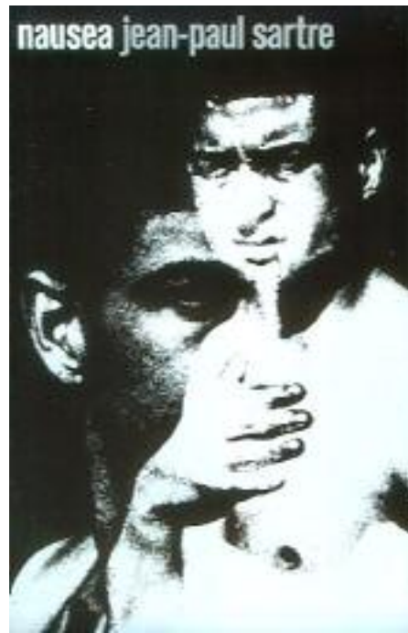
بەرگی رۆمانی (هیلنج)