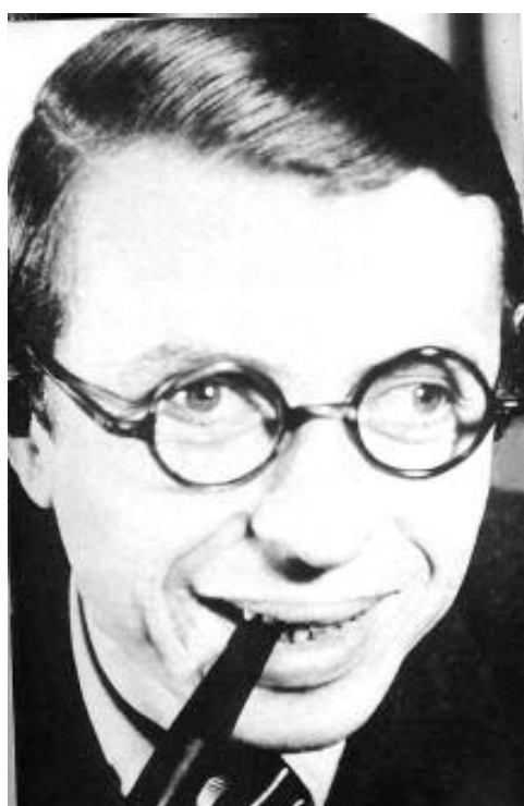
جان پۇل سارتەر