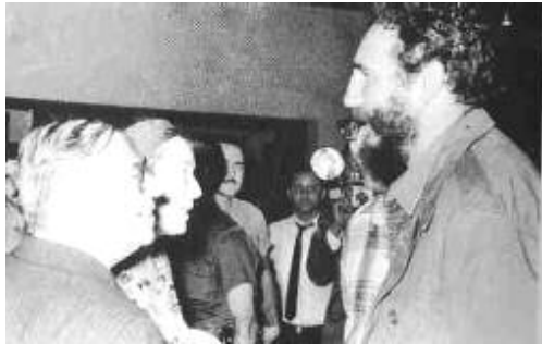
لهگه ن كاسترۇدا