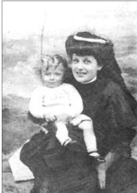
سارتهر و دایکی