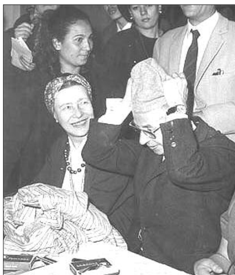
سارتەر و سيمون دى بۇقۇوار