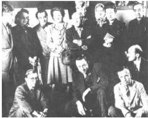
پيكاسۆو كامۆو سارتهر