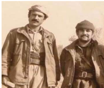
له‌گه‌ڵ گیانه‌هه‌ختکردووی گه‌وره ئه‌وه‌ری مه‌جید سو‌لتان دا

له‌و باره‌ سه‌خته‌دا به‌چه‌شه‌یرانی کوردایه‌تی مه‌شخه‌لی گه‌لگیرسانه‌وه‌ی شۆرش ب‌ل‌ند ده‌که‌نه‌وه. کاک جه‌لال ڕۆلی زۆر دلسۆزانه له‌ خا‌وکرده‌وه‌ی کیشه و هه‌را سیاسیه‌کانی سالانی پێش هه‌شتا و دوا‌ی هه‌شتا ده‌بینیت، له‌خۆبو‌وردووانه به‌رگه‌ی ڕۆژانی کوله‌مه‌رگی و ته‌نگانه‌ی کوردایه‌تی. ده‌گریت له‌سه‌ره‌تای هه‌شتاکان دا ڕوو ده‌کاته سووریا و له‌وئ نیشه‌جێ ده‌بی‌ت و به‌رده‌وام ده‌بی‌ت له‌ خزمه‌تی گشتی دا و پاشان ده‌چیت بۆ سوید و له‌وئ ده‌بی‌ته په‌نابه‌ری سیاسی.